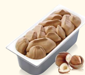
Haselnuss mit knackigen Haselnussstückchen