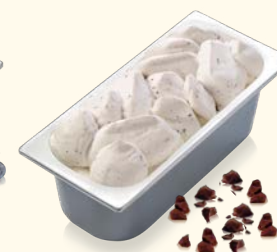
Stracciatella mit zartschmelzenden Milchschokoladenstückchen