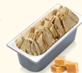
Dulce de Leche Milch Karamell mit Karamellsauce