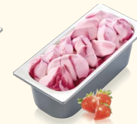
Erdbeer mit Erdbeersauce und -stückchen