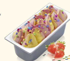
Konfetti- Erdbeere Erdbeereis und Eis mit Vanillegeschmack, dekoriert mit glasierten Schokolinsen