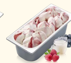
Joghurt- Waldfrucht mit Waldfruchtsauce