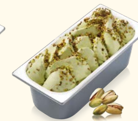
Pistazie mit Pistazienstückchen