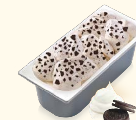
Cookies & Cream Cremiges Eis mit Obersgeschmack und vielen saftigen Keksstückchen