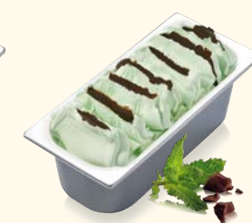
Minz Crunch mit knackiger Knusperschicht