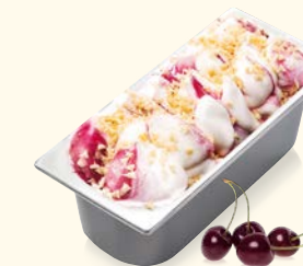
Amarena/ Spagnola mit Kirschsaft