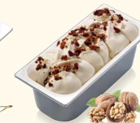
Walnuss mit Walnussstückchen