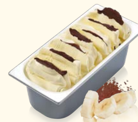
Banana Crunch mit Knusperschichten