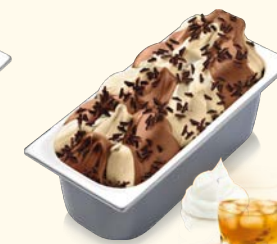
Baileys Cremiges Karamelleis mit süß-herbem Schlagobers- Whiskey Likör-Strudel