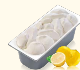
Sorbet Zitrone mit Zitronensaft