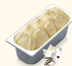
Vanille mit vermahlenden Vanilleschoten