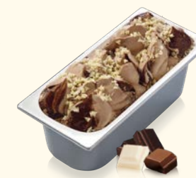
Triple Choc mit Schokoladensauce und weißen Schokostückchen