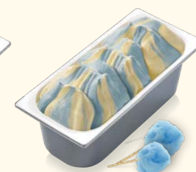
Blaue Zuckerwatte mit Zuckerwatte-Geschmack