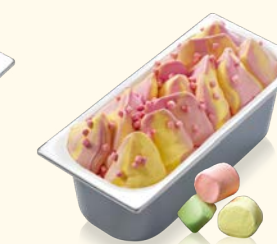
Bubble Gum Marshmallow mit Marshmallow-Stückchen