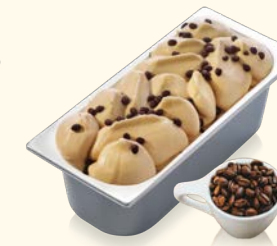
Café mit knusprigen Kaffeeschokobohnen