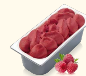
Sorbet Himbeer mit Himbeerstückchen